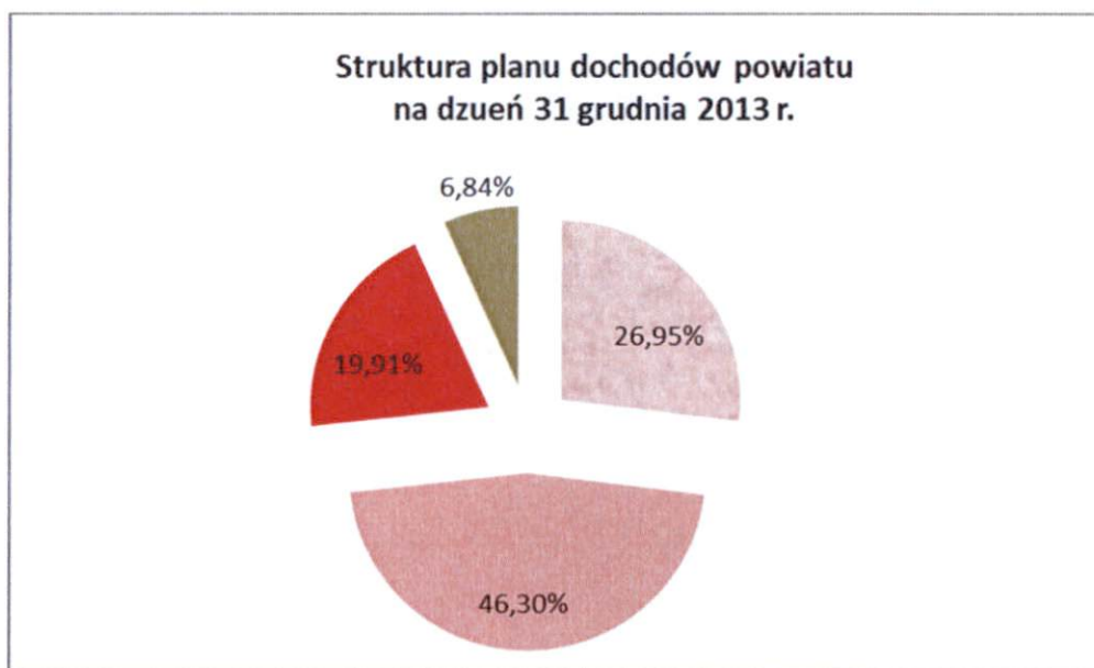
Wykres nr 2

Strukturę planu dochodów przedstawia poniższy wykres: